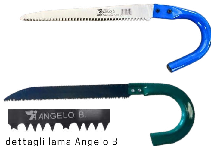
dettagli lama Angelo B